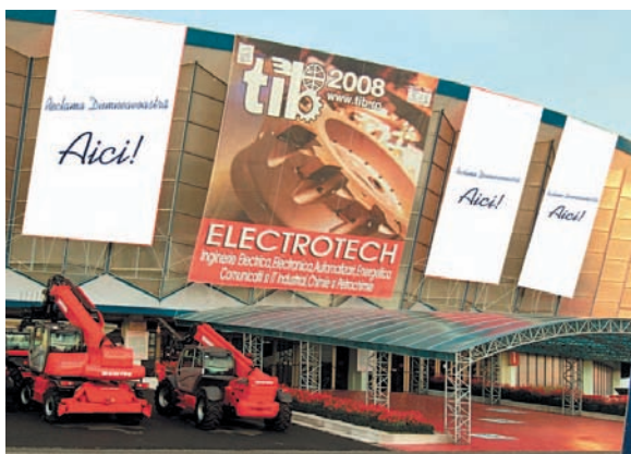
AFISARE BANNERE PE FATADA PAVILIONULUI A