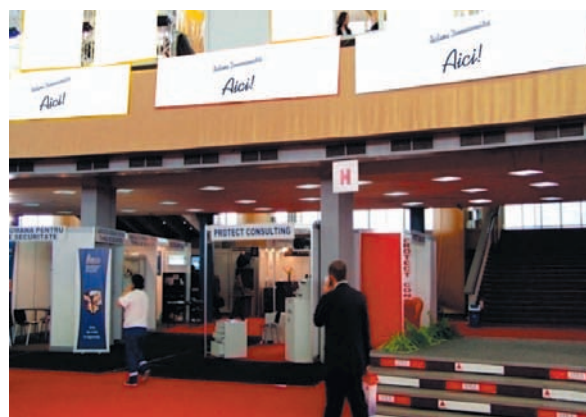
AFISARE BANNERE PAVILION A, FRIZA 4.50