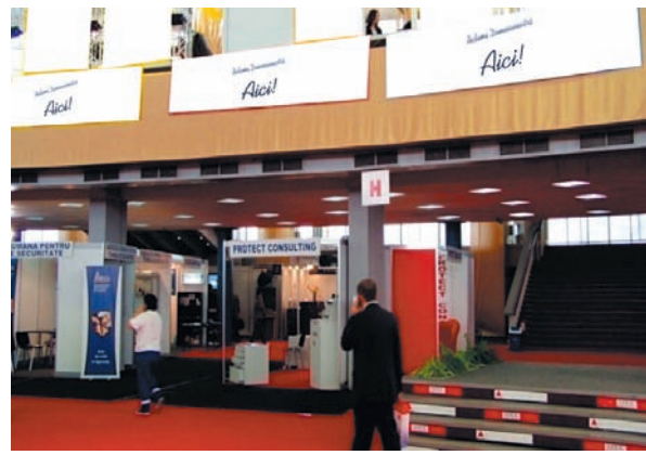
AFISARE BANNERE PAVILION A, FRIZA 4.50