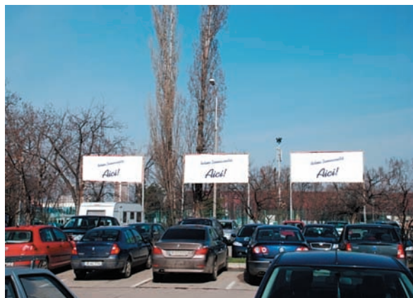
AFISARE BANNERE PARCAJ INTRARE B