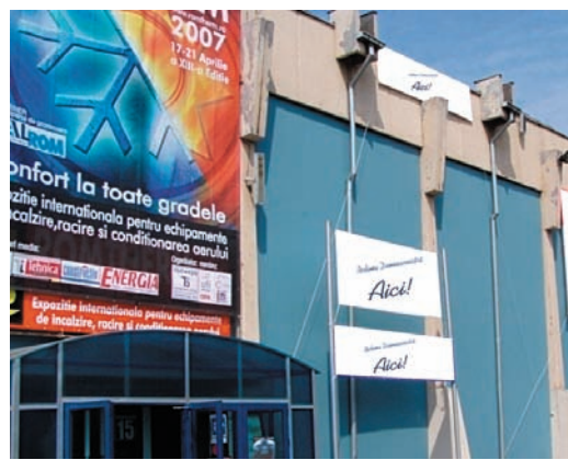
AFISARE BANNERE PE FATADA PAVILIONULUI C1