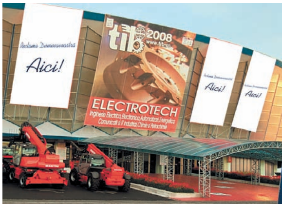
AFISARE BANNERE PE FATADA PAVILIONULUI A