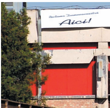
AFISARE BANNERE PE FATADA PAVILIONULUI C4