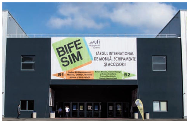
AFISARE BANNER PE FATADA PAVILIONULUI B3