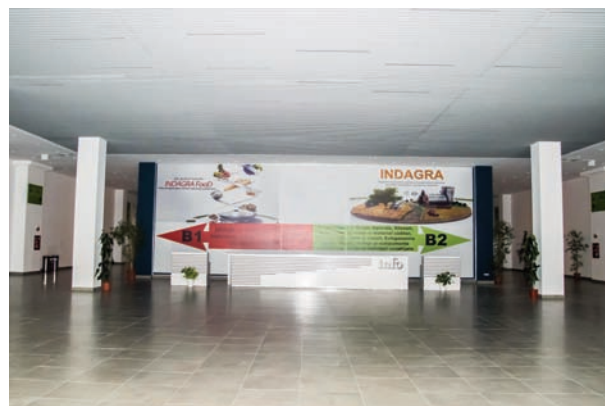
AFISARE BANNER IN INTERIORUL PAVILIONULUI B3, LA INFO DESK