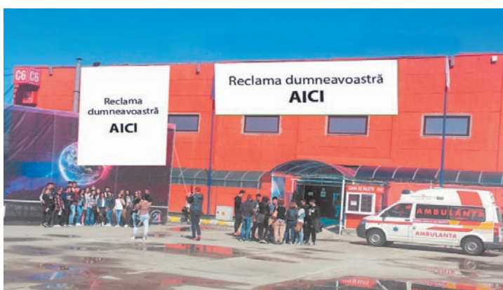
AFISARE BANNERE PE FATADA PAVILIONULUI C6