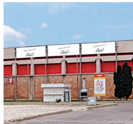
AFISARE BANNERE PE FATADA PAVILIONULUI C5