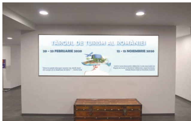
CASETA CU RAMA CLICK, DIMENSIUNE 320X110 CM