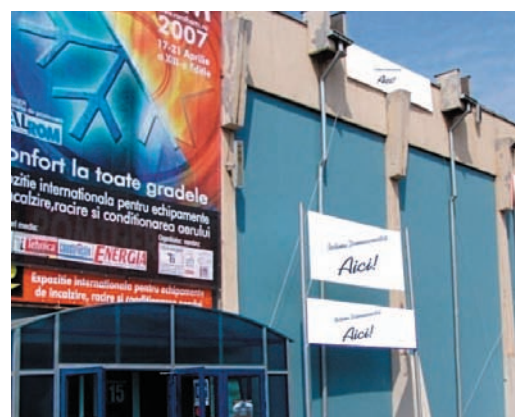
AFISARE BANNERE PE FATADA PAVILIONULUI C1