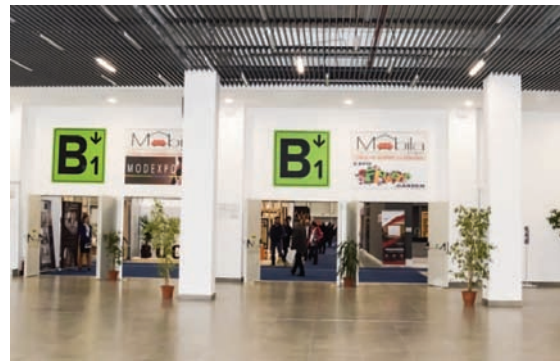
AFISARE BANNER POLICARBONAT IN INTERIORUL PAVILIOANELOR B, DEASUPRA SEMNALIZARII