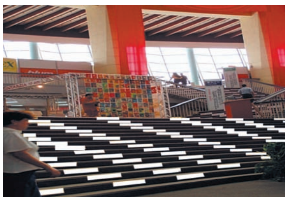
AFISARE STICKERE PE TREPTELE SI PARDOSEALA PAVILIONULUI CENTRAL