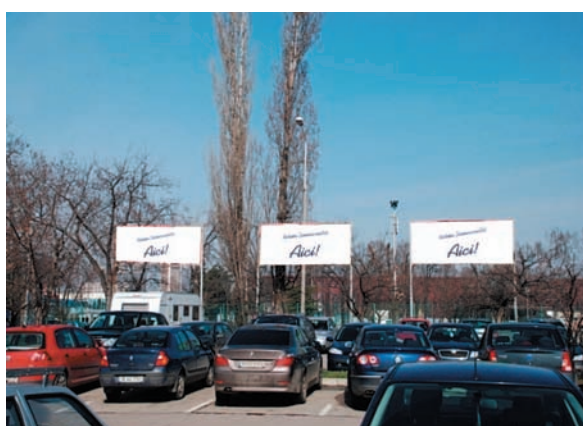
AFISARE BANNERE PARCAJ INTRARE B